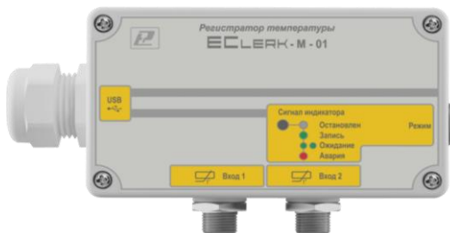
ECLerk-M-01-HP – без индикации измеренной температуры