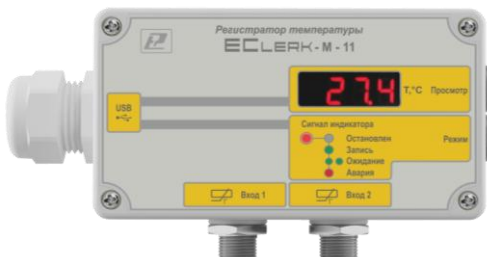
ECLerk-M-11-HP – с индикации измеренной температуры