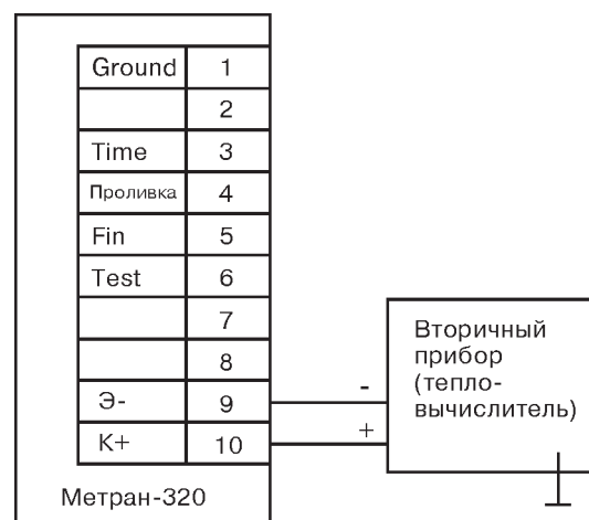
Рис. 1. Схема подключения расходомера Метран-320 к вторичному прибору.