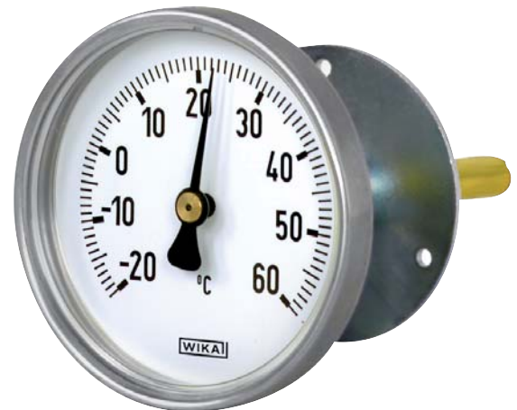
Биметаллический термометр модель А48.10.080