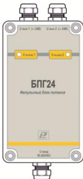
Рисунок 1 – Внешний вид блока питания импульсного в герметичном корпусе БПГ 24 с двумя каналами

2. К входным клеммам блока питания подключается напряжение питающей сети.