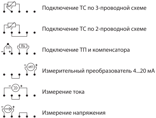
Схема электрических соединений