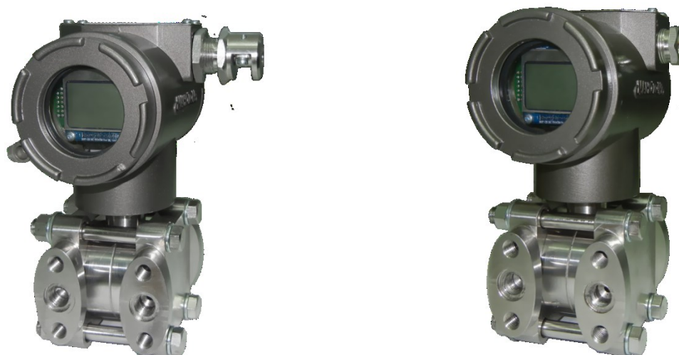
Рисунок 2 – Фотографии общего вида датчиков давления ДМ5017 фланцевого исполнения с индикатором