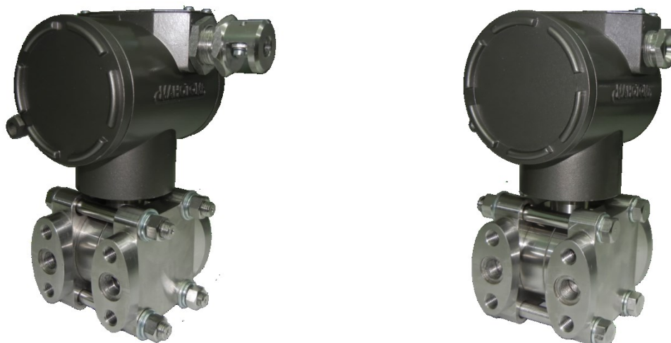
Рисунок 1 – Фотографии общего вида датчиков давления ДМ5017 фланцевого исполнения без индикатора

Фотографии общего вида датчиков приведены на рисунках 1 – 4.