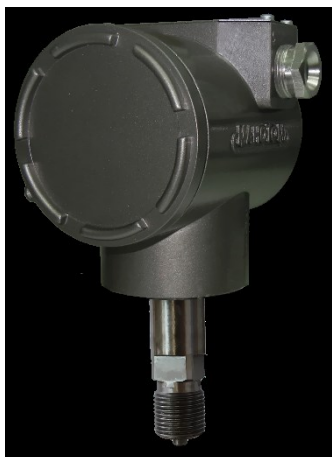
Рисунок 4 – Фотография общего вида датчиков давления ДМ5017 штуцерного исполнения без индикатора

Схема пломбирования от несанкционированного доступа внутрь датчиков давления ДМ5017 и место нанесения знака поверки приведены на рисунке 5.