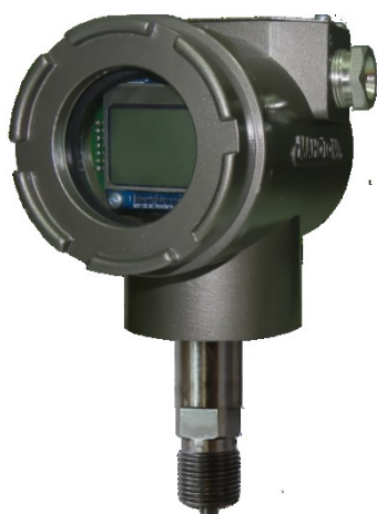
Рисунок 3 – Фотография общего вида датчиков давления ДМ5017 штуцерного исполнения с индикатором