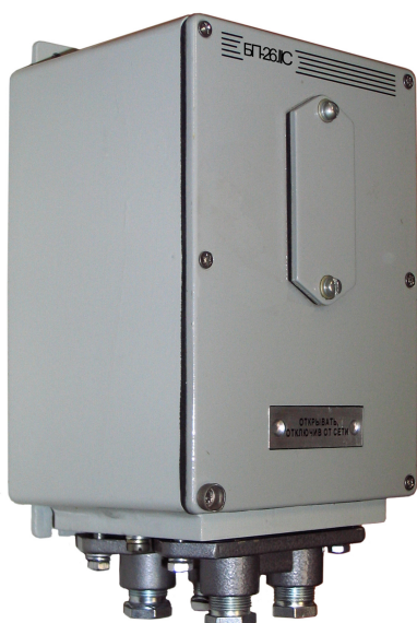
Блок питания БП-26.IIC

Блок питания с выходными искробезопасными электрическими цепями уровня «ib» предназначен для установки вне взрывоопасных зон помещений и наружных установок. Имеет маркировку [Ex ib Gb ]IIC.